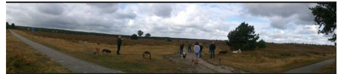
Observaties op het Rozendaalse Veld